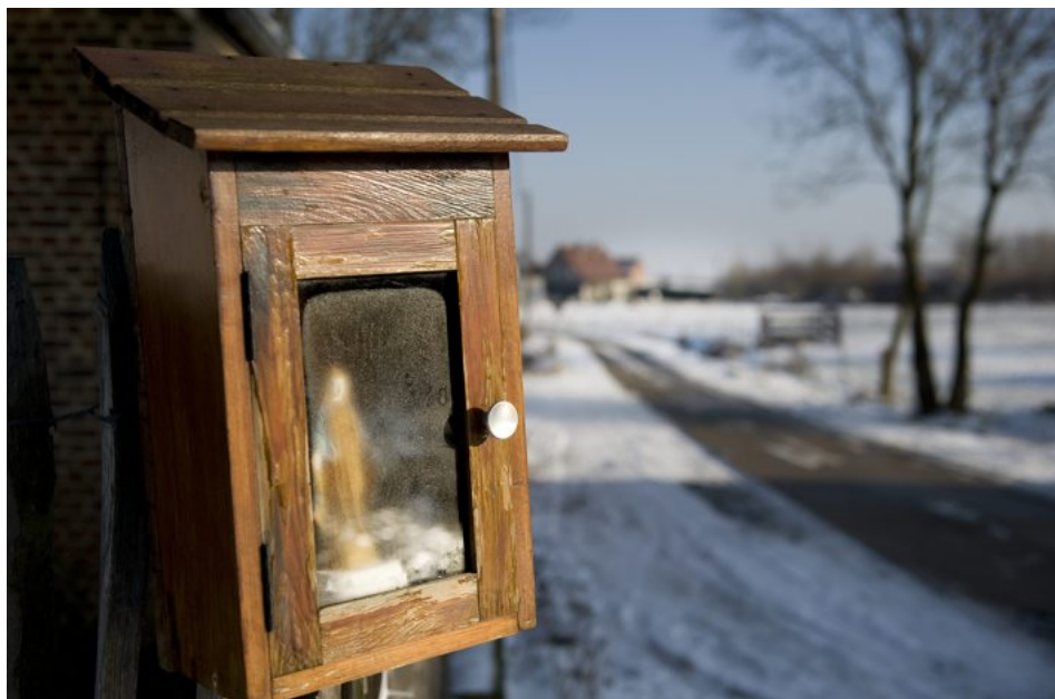
Zullen plattelandsgemeenten ook baat hebben bij de decentralisatie?

Wat? Als schaalvergroting, en dus fusies, uitkomst moeten bieden om tot meer middelen voor de gemeentes te komen, dan zijn we nog ver van huis.