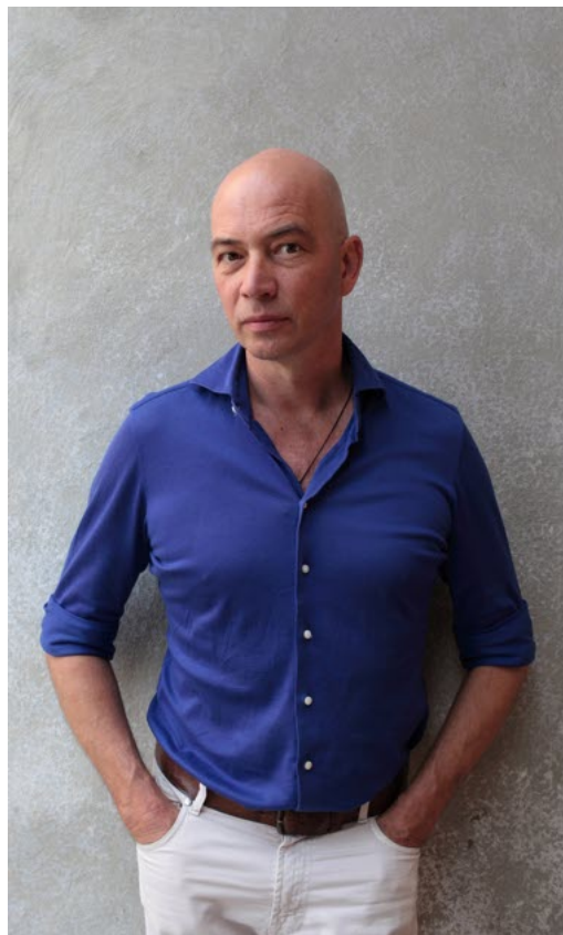
Tommy Wieringa.

eerste organisme waarvan het genoom volledig in kaart werd gebracht.